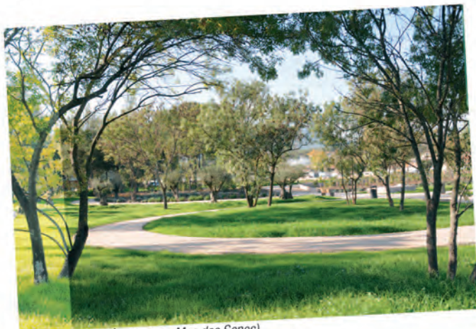
parc des Savels (face au Mas des Senes)