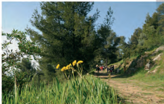
balade dans les sentiers du Thouars