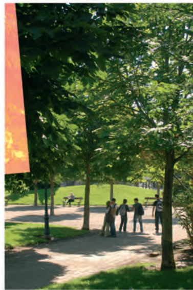
jardin Veyret (face à Intermarché)

Venez en famille faire du cerf-volant, du bicross ou simplement vous promener à la Bouilla, dans le Plan. Profitez de moments de détente et de jeux avec vos enfants dans les jardins et parcs de la Ville : le jardin Veyret, le jardin Allende, le jardin des tout-petits, la place Louise Michel ou encore le parc des Savels.