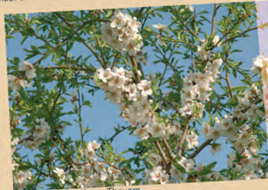
amandiers plantés au Thouars

Laurane - Ferragne - Princesse Ardechoise - Sultane - Texas Agen - Bartre - Bonifacio - Dorée Blanquette du Couteau - Trochet Béraude - Mas Bovera - Tuono Ferrastar - Languedoc - Mary Dupuy Hoff - Nonpareil - Petite Colle - Pointue d'Aureille Tardive de la Verdière - Vierzon - Mazzetto - Floquette Pleureur - Local - Canette - Ferraduel - Francoli - Saint Charles Glorieta - Narbonne - Ferralaise - Côte d'Or - Ai