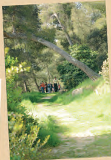
sentier de balade

Abiétacées Abiétacées Anarcordiaccées Anarcordiaccées Borraginacées Borraginacées Caprifoliacées Caprifoliacées Cistacées Cistacées Cupressacées Cupressacées Ericacées Ericacées Fagacées Fagacées Fagacées Liamacées Liamacées Liamacées Liliacées Liliacées Liliacées Myrtacées Myrtacées