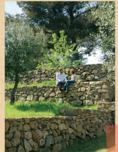
conservatoire de l'amandier