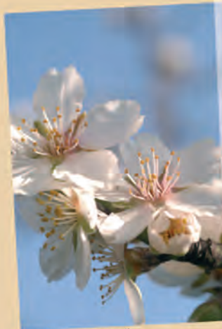
la fleur d'amandier