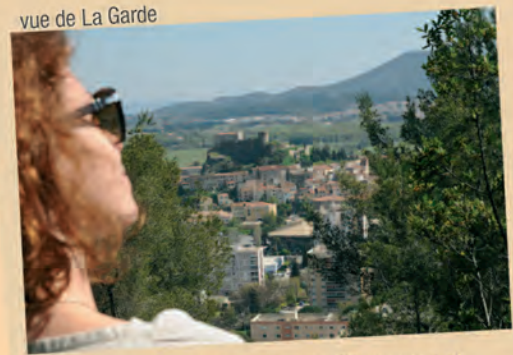
vue de La Garde

La mise en valeur de la colline du Thouars est reliée à un autre projet municipal : un travail pédagogique pour que les enfants apprennent le cycle de vie d'un arbre et la nécessité écologique de préserver les forêts . Un programme d'éducation visant à une prise de conscience des équilibres à sauvegarder.