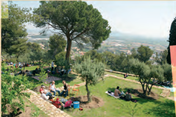
picnique lors de la Fête du Printemps

Une zone de promenade : trois sentiers de balades, comportant différents niveaux de difficultés, pour les petits, les courageux et les téméraires , permettent de faire connaissance avec le patrimoine naturel. Une zone de découverte : un sentier botanique rythmé par une quarantaine de panneaux explicatifs sur la flore méditerranéenne offre aux visiteurs une promenade pédagogique. Une zone historique : les ruines de la bastide oubliée , bâti agricole provençal, ont été mises en valeur. Une zone géographique : le point de vue dégagé en haut de la colline offre aux promeneurs un magnifique panorama de La Garde. Des chemins piétonniers, escaliers et restanques en pierre ont été aménagés afin d'apprécier au mieux cette zone protégée.