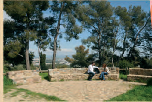
le coin de causerie