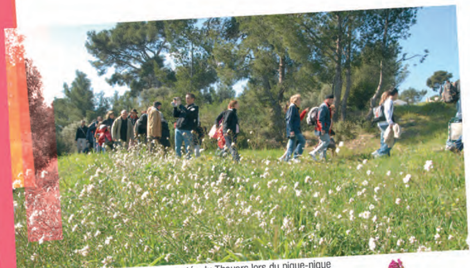
montée du Thouars lors du pique-nique organisé chaque année le lundi de Pâques

Ajonc de Provence Ulex parviflorus Famille des Papilionacées