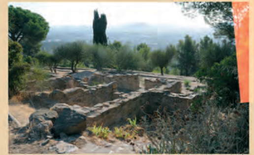
ruines de la bastide oubliée

Arbre fruitier présent à la campagne et souvent associé à la vigne, à l'olivier et à la lavande, l'amandier faisait partie intégrante du paysage gardéen au début du siècle. On en trouvait sous forme de vergers fruitiers, dans le parc forestier du Thouars mais aussi dans la zone du Plan et sur le chemin de Ste Musse. Les amandes étaient récoltées et partaient dans les coopératives fruitières. Les fruits étaient consommés naturellement ou transformés en pâte d'amande, biscuits et confiseries (nougats, calissons, dragées, pralines...).