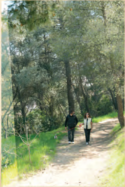
sentier de balade