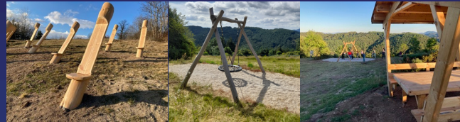
Site d'observation des étoiles Jeux pour enfants Tables de pique-nique abritées.

(Flèché à partir de la mairie de Saint-Pierre-du-Champ, et de l'auberge du Campos). Boucle de 4,3 km / dénivelé de 120 m / 1 h 30 à 2 h. Difficulté moyenne, parcours pour toute la famille, mais avec de bonnes chaussures de marche fermées. Adaptation du parcours en numérique (LegendR) Aménagements :