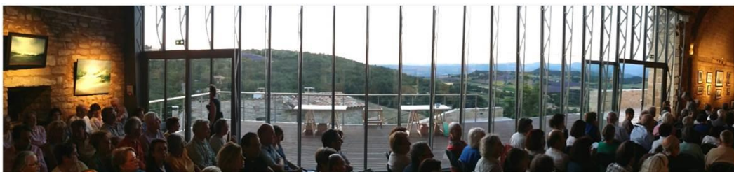
église Saint-Christophe Vachères, « soir de concert ».