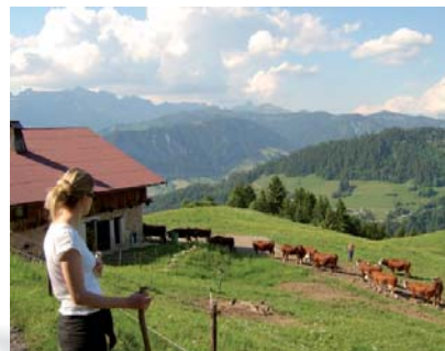
Alpage des Chalets Brulés

Itinéraire facile en aller-retour. Accès routier : depuis Crest-Voland, suivre la route menant aux Saisies sur 3 kilomètres, se garer sur le parking en bord de route. Depuis le parking, poursuivre sur la piste carrossable puis à travers les alpages. Parcours bucolique au milieu des alpages et des fermes en activité. Tout au long du parcours, on y croise vaches et chèvres pâturant face au massif du Mont-Blanc et la chaîne des Aravis.