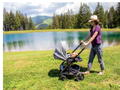
Plan d'eau du Mont Lachat

Itinéraire facile en aller-retour. Accès routier : depuis Crest-Voland, suivre la route menant aux Saisies sur 4 kilomètres et se garer au niveau de la Croix des Ayes. Depuis le parking, prendre la route carrossable en direction du Mont Lachat. Vous longez la superbe tourbière du Beaufortain/Val d'Arly (réserve naturelle) avant d'arriver sur le plateau du Lachat. Le tour du plan d'eau est possible avec une poussette 4X4. Au plan d'eau : restaurant, table pique-nique, barbecue, pêche, berges en herbe et WC. La baignade est interdite.