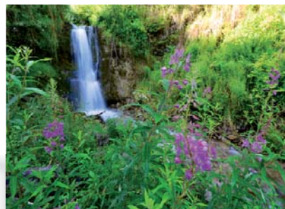
Cascade du nant du Moulin

Itinéraire facile en aller-retour, réalisable depuis le hameau du Cernix ou depuis le hameau de Paravy. La balade passe entre les hameaux de Crest-Voland Cohennoz, les prairies et des lieux de pause agréables : moulin Ainoz, plan d'eau du Cernix et points de vues. Cette route communale est peu fréquentée.