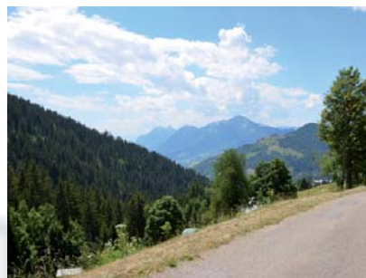
Vue plongeante sur la combe de Savoie

Itinéraire facile en aller-retour. Accès routier : depuis Crest-Voland, rejoindre le Cernix. Depuis le Cernix, prendre la montée en direction du centre de vacances du Prarian. Le contourner par la route et poursuivre la route communale, au-dessus des prairies du Vouillon. Une fois au parking de randonnée, vous pouvez faire demi-tour ou poursuivre, pour rejoindre l'itinéraire n° 5.