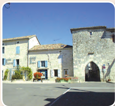
▲ Porte de la ville