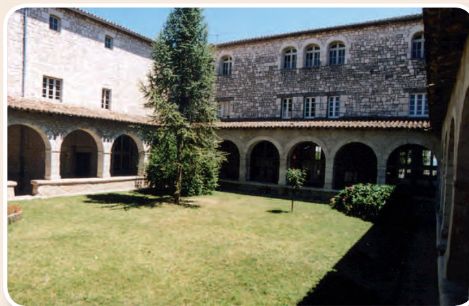
▲ Le couvent des Ursulines