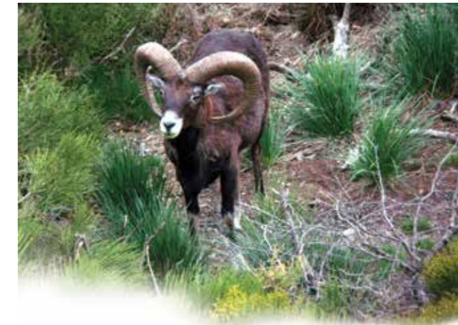
Un mâle adulte, en position typique d'observation, a certainement repéré un intrus ou un congénère.

Au détour du sentier vous pourriez être surpris par un sifflement bref et fort, c'est le cri d'alarme du mouflon ! Sa présence peut aussi être trahie au printemps par les bêlements des jeunes, similaires aux cris des agneaux.