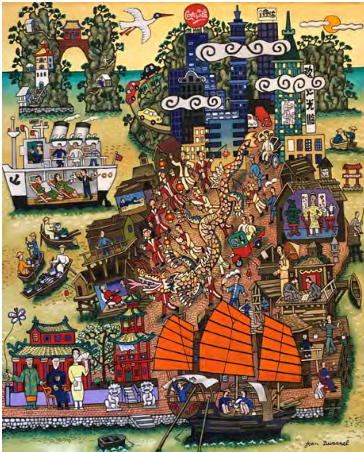
«Asie si tu veux» Huile sur toile 100 x 81 cm