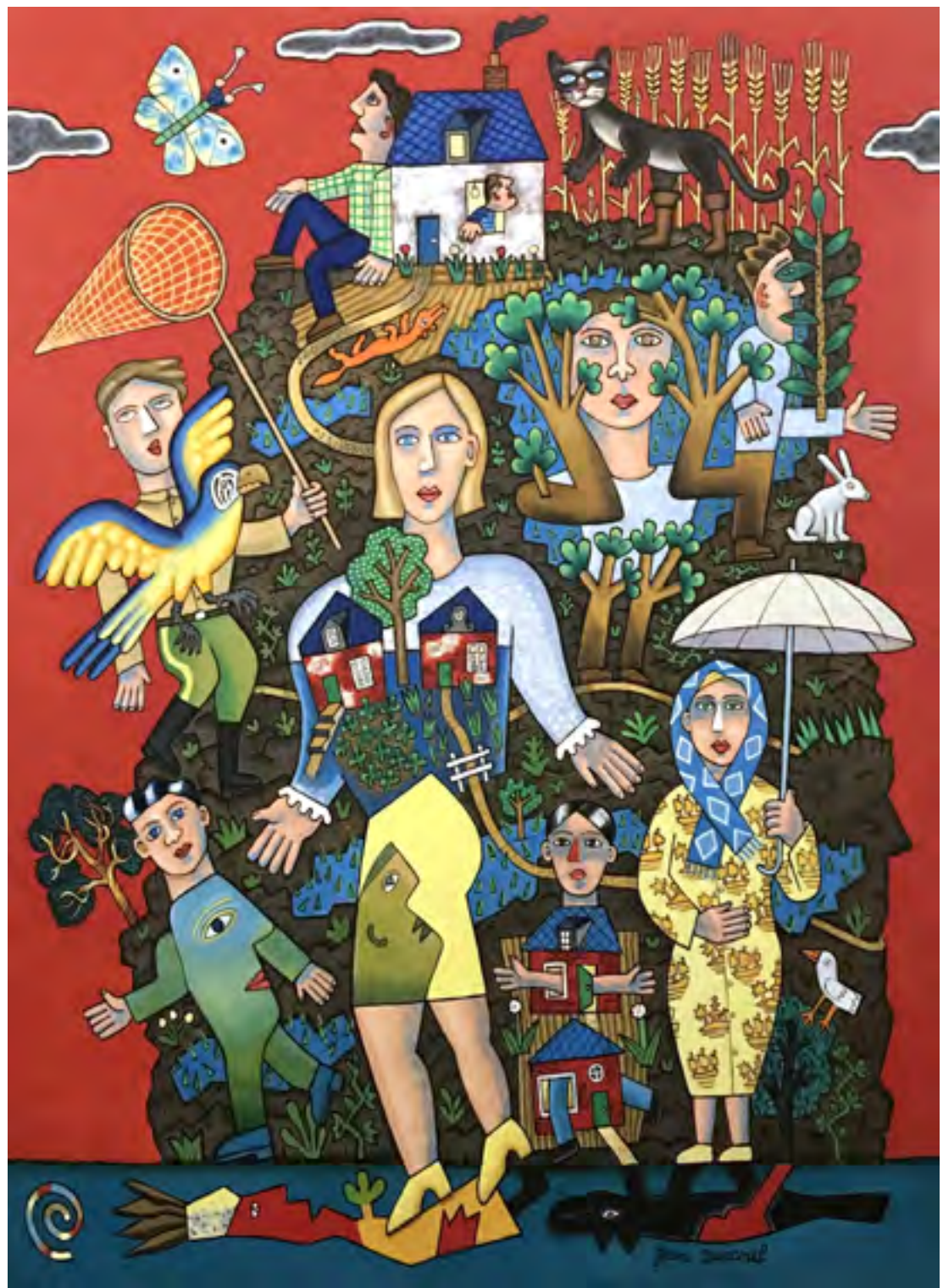
«Le chat botté» Huile sur toile 130 x 97 cm