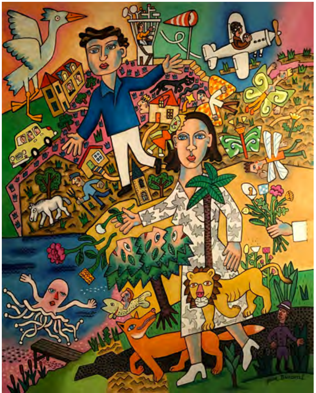
«Envoi de fleurs» Huile sur toile 92 x 73 cm