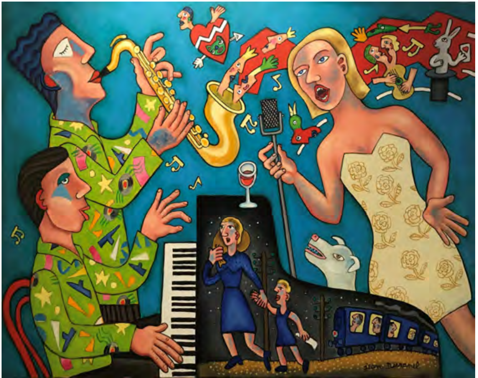
«Le train du blues» - Huile sur toile - 73 x 92 cm