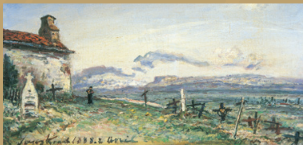
« Le cimetière de Balbins, Huile sur toile, 1888 » (Musée Faure, Aix-les-Bains).

Office de tourisme du Pays de Bièvre-Liers 5, place Hector-Berlioz 38260 La Côte-Saint-André Tél. 04 74 20 61 43 www.tourisme-bievre-liers.fr info@tourisme-bievre-liers.fr