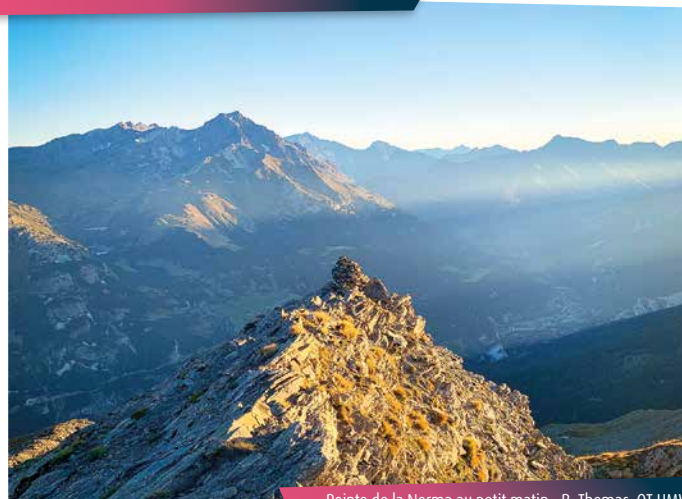
Pointe de la Norma au petit matin

N'hésitez pas à partir tôt le matin pour atteindre votre destination avant que le soleil arrive à son zénith. La descente n'en sera que plus confortable et vous laissera le loisir de pauses fraîcheur régénérantes.