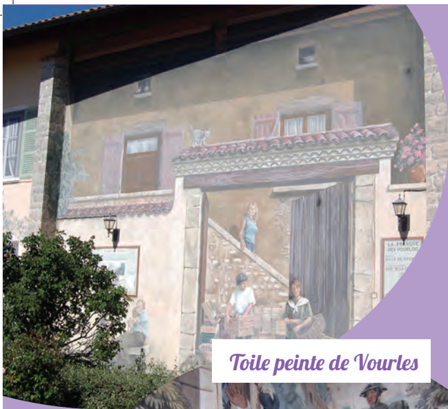
Toile peinte de Vourles