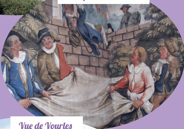
Vue de Vourles