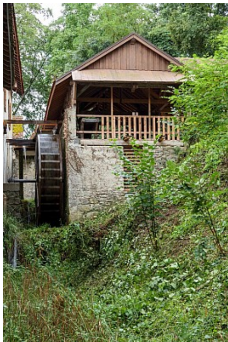
Mairie de Margencel

Moulin actionné par l'eau du Redon, dont la force hydraulique était augmentée grâce à un canal qui amenait directement l'eau sur la roue. Rénové, les roues de ce moulin ont aujourd'hui disparu.