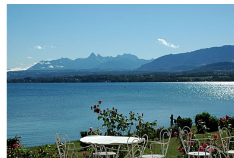
J L Delachaussee

Depuis la plage, vue imprenable sur les Préalpes et la côte suisse