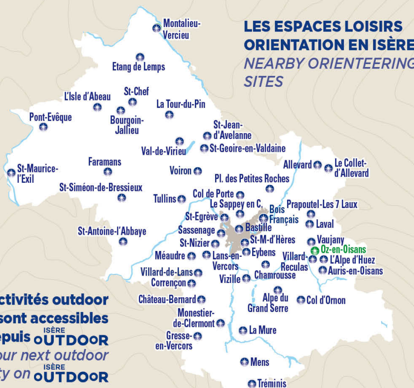
LES ESPACES LOISIRS ORIENTATION EN ISÈRE NEARBY ORIENTEERING SITES

This trail takes you around the local heritage and architecture of Oz village, typical of the Oisans area.