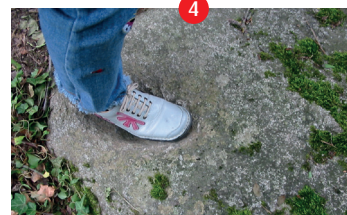
Pied du Diable