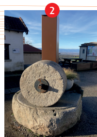
Meules du Moulin Roche