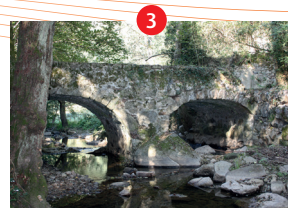
Pont vers le Moulin Roche