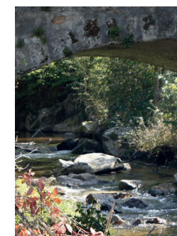
Rivière la Charpassonne