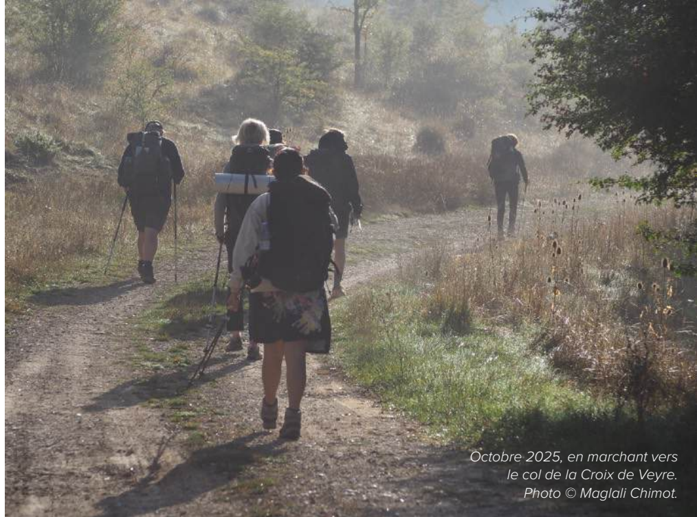
Octobre 2025, en marchant vers le col de la Croix de Veyre.