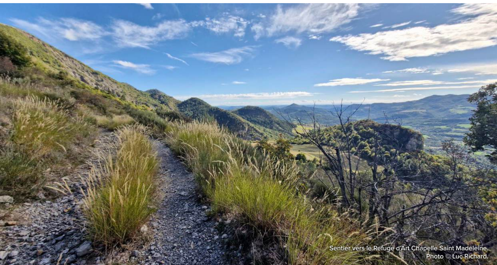
Sentier vers le Refuge d'Art Chapelle Saint Madeleine.