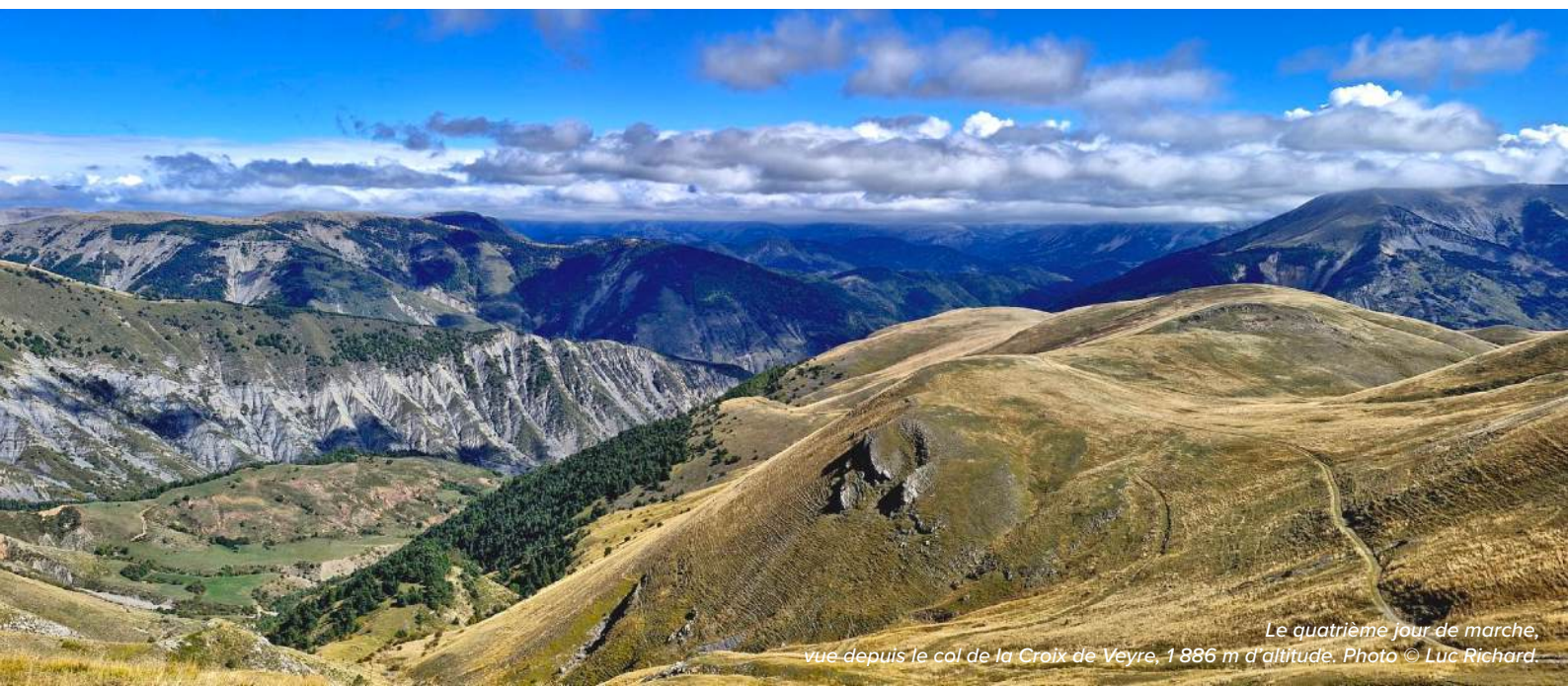
Le quatrième jour de marche, vue depuis le col de la Croix de Veyre, 1 886 m d'altitude.

* Nous pouvons être amenés à modifier l'itinéraire indiqué : soit au niveau de l'organisation (problème de surcharge des hébergements, modification de l'état du terrain, éboulements, sentiers dégradés, etc.), soit directement du fait du guide (météo, niveau du groupe, etc.). Ces modifications sont toujours faites dans votre intérêt, pour votre sécurité et pour un meilleur confort.