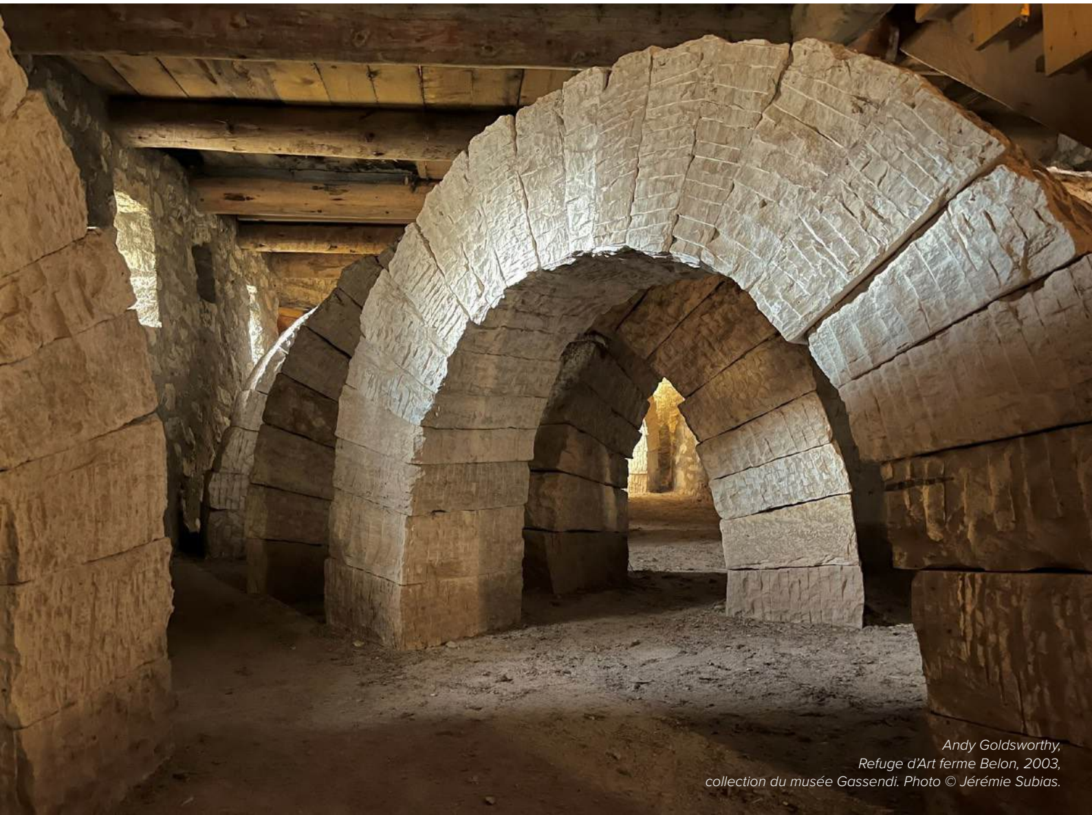
Andy Goldsworthy, Refuge d'Art ferme Belon, 2003, collection du musée Gassendi.