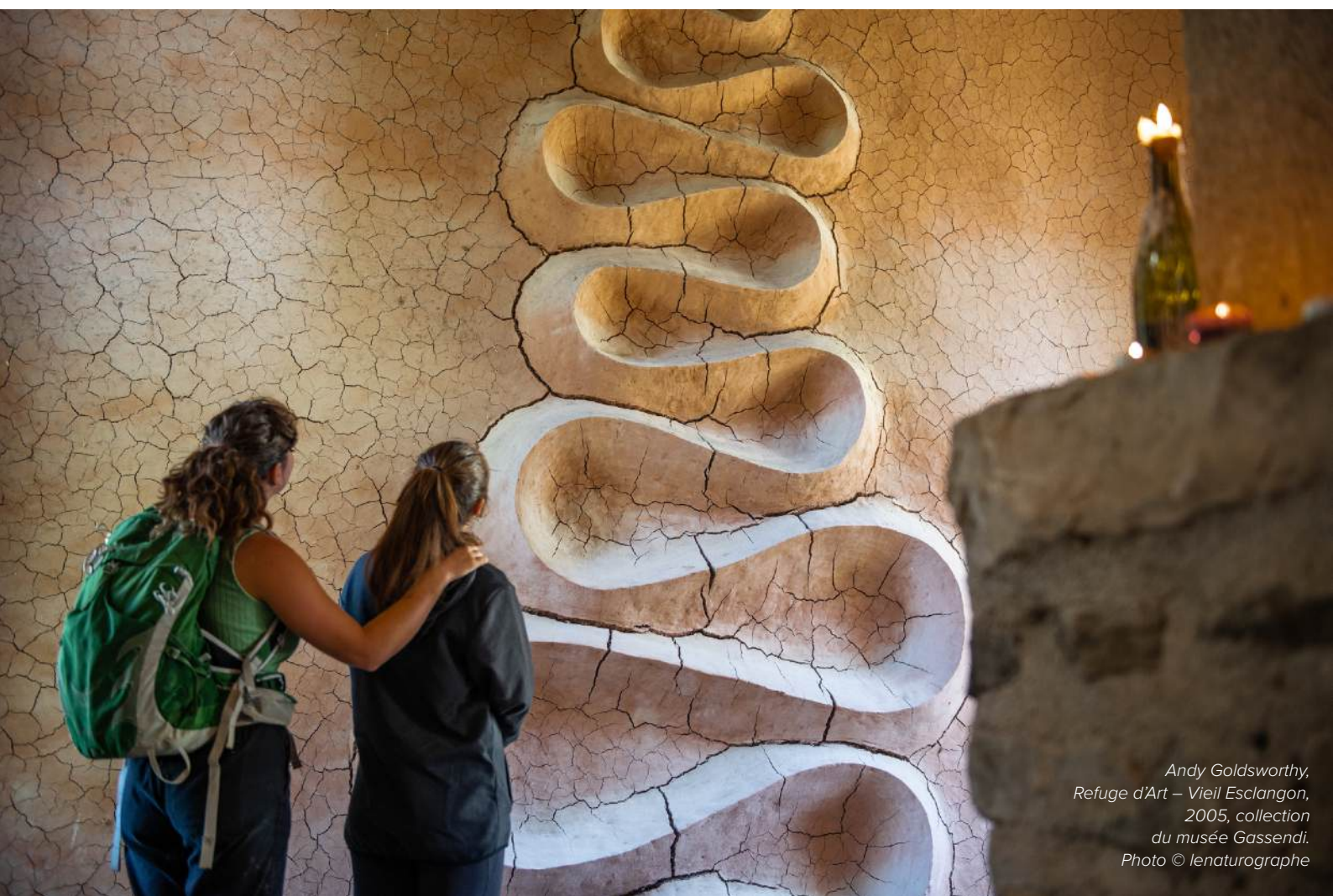
Andy Goldsworthy, Refuge d'Art – Vieil Esclanton, 2005, collection du musée Gassendi.

DU 31 MAI AU 5 JUIN 2026 ET DU 20 AU 25 SEPTEMBRE 2026