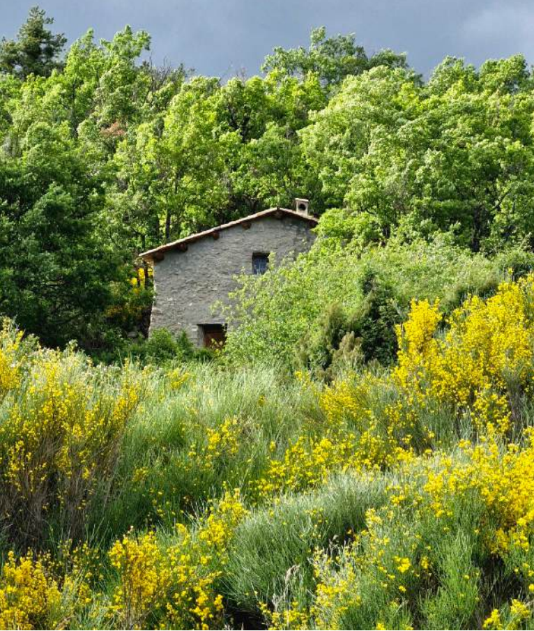
En arrivant au Refuge d'Art – Ferme Belon.