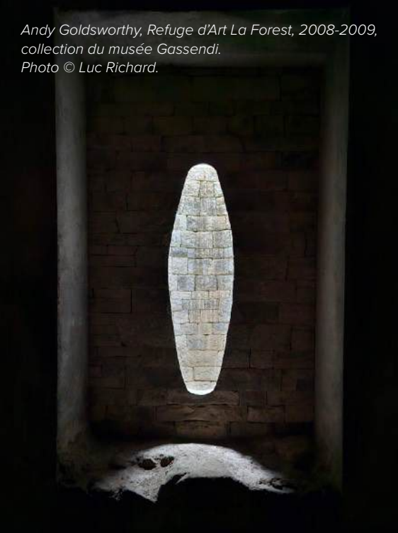
Andy Goldsworthy, Refuge d'Art La Forest, 2008-2009, collection du musée Gassendi.