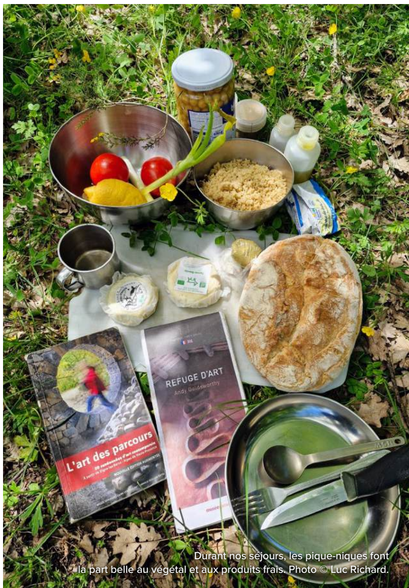
Durant nos séjours, les pique-niques font la part belle au végétal et aux produits frais.