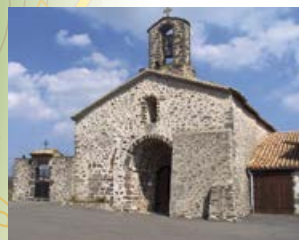
L'église de Saint-Gineys en Coiron

Descendre en infléchissant à gauche et passer devant le panneau « infos randonnées ».