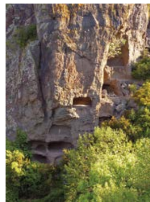
Les balmes de Montbrun

Le retour au village de St-Gineys en-Coiron s'effectue par le même itinéraire.