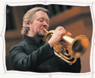
Sergei NAKARIAKOV, trompette et bugle

Le joueur de trompette russe né israélien, s'est établi comme l'un des joueurs de trompette le plus convoité sur la scène internationale . Béni par une rare combinaison de virtuosité époustouflante, des sons suaves et de velours et une profonde sensibilité, on l'appelle « Le Paganini de la trompette » et « Le Caruso de la trompette ». Nakariakov a, à lui seul, mis le bugle à l'honneur sur le plan des concerts et joue un répertoire unique. « Sergei Nakariakov joue de la trompette comme nous respirons tous - si nous avons de la chance ! » San Francisco Chronicle