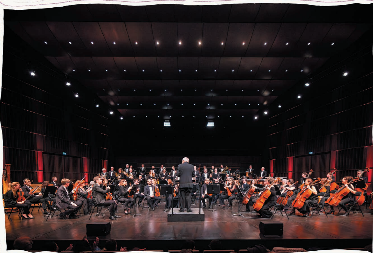
Les musiciens de l'Orchestre symphonique de l'Aube