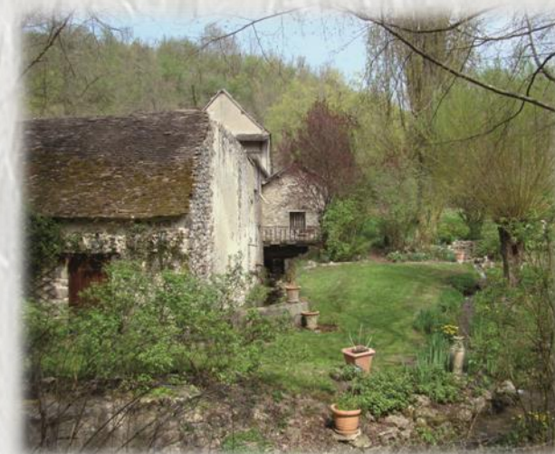
Moulin église à Vernou La Celle

Entre vergers et moulins, ce circuit visite plusieurs vallons et invite à une promenade dans le bocage. Vous découvrirez une carrière de tuf, qui permet de reconstituer le climat préhistorique de l'endroit.