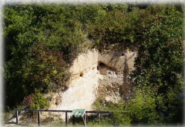
« Tuf », une roche témoin à Vernou-La Celle