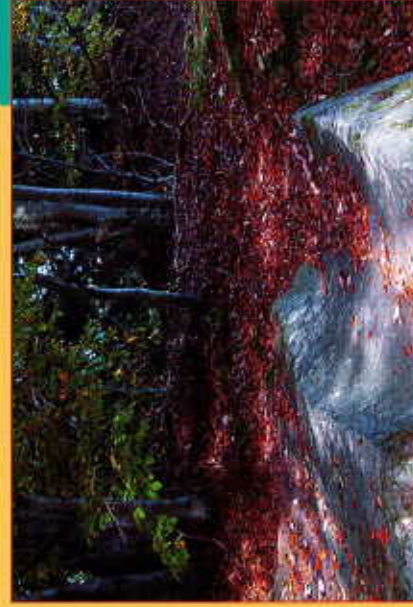
La Pierre Plane

8 Au retour, continuer les balises vertes et à 50 mètres, la Pierre Pique Nique sur la droite. En continuant entre chênes, hêtres et pins, on rejoint Saint Hilaire en passant par le lavoir et le Pont de Cusson.