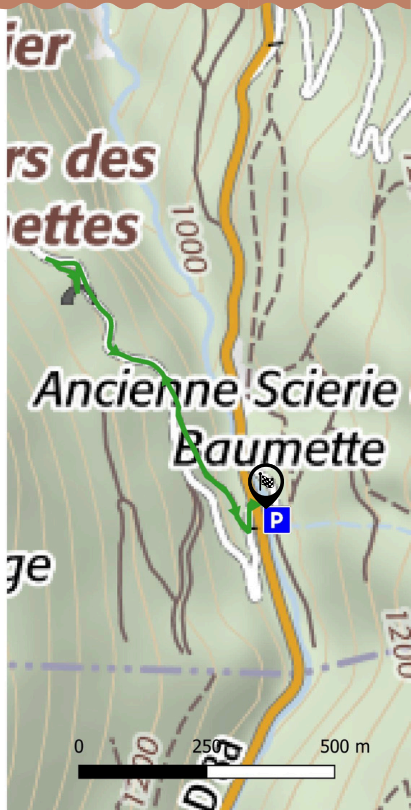
Sur la trace des Charbonnières