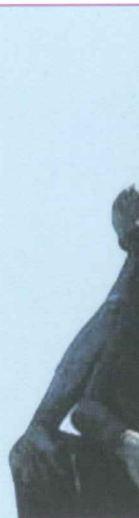
Statue de R... prisonnière t... détenue