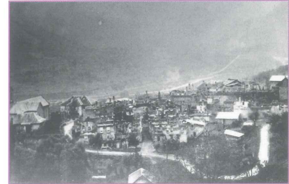
Villargondran. Incendie du 23 août 1944.