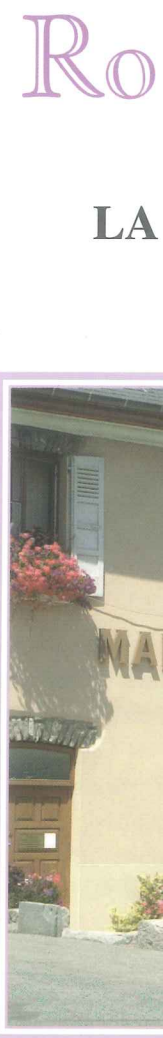
Imp. Roux - St-Jean-de-Mine (1901/RZ/08/4)