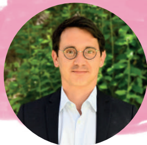
JULIEN GONDARD MAIRE DE FONTAINEBLEAU