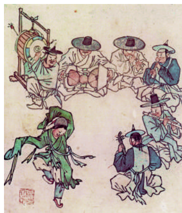
© Jeune danseur et musiciens. Feuille d'album, peintures de genre. Musée national de Corée.