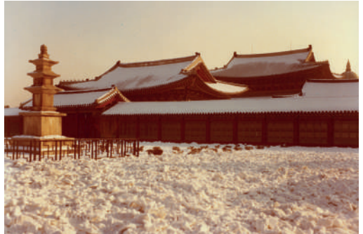
Séoul, janvier 1981, palais Kyongbok, photo Pierre Cambon.

Conservateur général du patrimoine, Pierre Cambon était chargé des collections coréennes au musée national des arts asiatiques-Guimet jusqu'en juillet 2022. Auteur de L'art coréen au musée Guimet et de différents articles dans la Revue des musées de France , il a piloté plusieurs expositions sur l'art de la Corée. Il a occupé des postes à Séoul, de 1981 à 1982, notamment aux services culturels de l'ambassade de France en Corée, puis, de 1988 à 1992, comme attaché culturel. Il a également travaillé à Pyongyang, en tant que consultant pour le Centre du Patrimoine mondial de l'UNESCO.