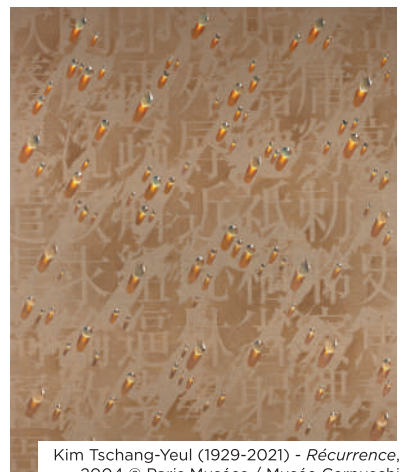
Kim Tschang-yeul (1929-2021) - Récurrence, 2004

Depuis quelques années, l'art coréen contemporain suscite un nouvel intérêt de la part du marché de l'art international et des institutions occidentales. Cet essor est le résultat d'un long cheminement des artistes de la péninsule pour trouver une expression propre qui ne soit pas la redite de vocabulaires japonais ou américains. Cette conférence retracera succinctement les étapes qui ont mené à la création d'un art coréen contemporain et à sa reconnaissance internationale.