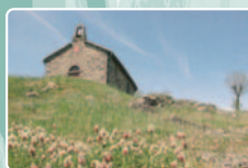
La chapelle de Fraissinet

Niveau : Facile Distance : 24 km Dénivelé : 330 m