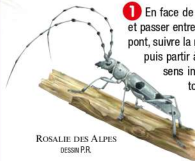
ROSALIE DES ALPES DESSIN P.R.

La campagne vallonnée, sur les hauteurs de Bellenaves, réserve son lot de vues remarquables, dont le panorama depuis le Vert-Plateau, aux portes de la forêt domaniale des Colettes.