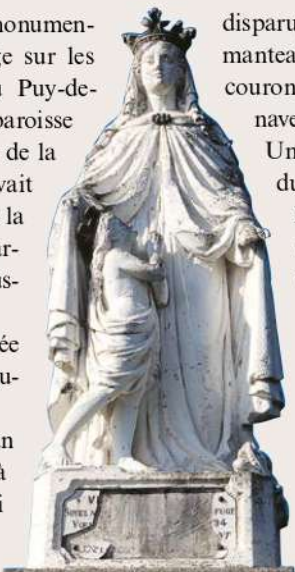
NOTRE-DAME-DE-LA-DÉFENSE, BELLENAVES

Un pèlerinage annuel a perduré à Notre-Dame-de-la-Défense jusqu'en 1970, date du centième anniversaire de la guerre.