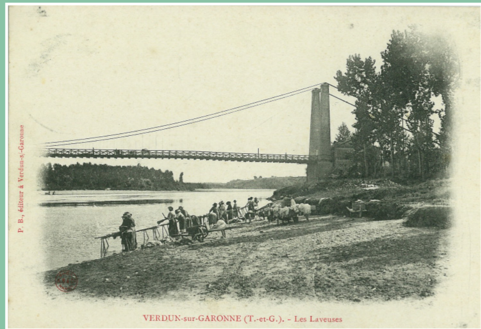
VERDUN-sur-GARONNE (T.-et-G.). - Les Laveuses

être capricieuse, terrible et dévastatrice par ses débordements. Il faut remonter à 1875 pour trouver la pire crue de Garonne (7,30 m). Le 11 juin 2000, le fleuve avait déjà atteint les 6,30 m comme ce 11 janvier 2022 où elle atteint le parking du stade. Verdun-sur-Garonne a vécu les guerres du Moyen-âge puis les guerres de religion, mais n'a jamais subi de siège vraiment dévastateur. Après la révolution, Verdun-sur-Garonne perd quelque peu de son importance administrative pour devenir le chef-lieu de canton qu'il est à ce jour.