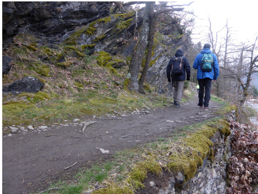
Sur le chemin de l'aqueduc des fontaines...