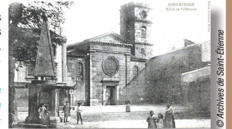
L'église de Valbenoîte

> Accès possible à l'église Notre-Dame de Valbenoîte église romane remontant au XIII e siècle, inscrite à l'inventaire des monuments historiques : traverser l'avenue de Rochetaillée, continuer en face sur 100 m et prendre à droite.