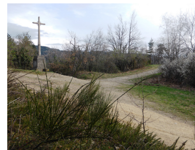
La croix du Perthuis

• Comit  d partemental de la randonn e p destre de la Loire : 04 77 37 28 24, www.rando-loire.org .