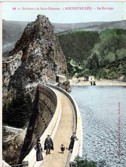
Le barrage du Gouffre-d'Enfer

Dès 1862, l'aqueduc des fontaines (ou aqueduc des sources) alimentait en eau potable les fontaines de Saint-Étienne. L'eau était captée de quelques 800 sources situées dans le Grand-Bois, une zone alors marécageuse au-dessus du village du Bessat. 54 km de drains et de canalisations ont été construits pour acheminer cette eau dans l'aqueduc principal, long de 18 km avec près de 200 regards aménagés. L'aqueduc des fontaines était la première installation hydraulique de la vallée du Furan, juste avant le barrage du Gouffre-d'Enfer, achevé en 1866.