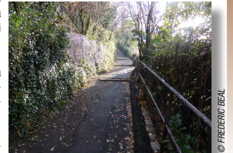
La montée Champollion

Au bout de la rue des Mouliniers, gravir les escaliers et la montée Champollion qui débouche sur la rue Crozet-Bous-singault. Suivre à droite cette rue qui s'élève progressivement pour atteindre le Portail Rouge.