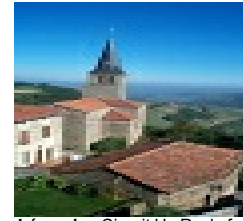
Légende : Circuit H : Rochefort

Balisage : lettre du circuit sur fond bleu. Départ place du Plon. Ce parcours facile d'accès, vous conduira à Rochefort, site médiéval avec sa chapelle romane et les ruines du donjon. Panorama sur les Alpes et Lyon, table d'orientation sur le sentier.