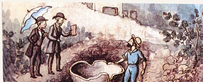
Fouille d'une cave datée du II e siècle aux Bormettes

Les gallo-romains sont à l'origine de nombreuses installations agricoles, ancêtres des domaines actuels . Des vestiges de ces fundi ont notamment été découverts au XIX e siècle dans la plaine des Bormettes. Des meules à grain, dolia (citerne en céramique), amphores, éléments de pressoirs attestent de la culture des céréales, de la vigne et des oliviers.