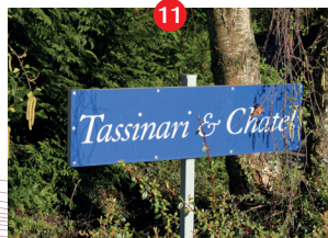
Tassinari & Chatel