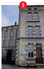
3 Fabrique de soies à bluter