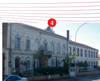
4 Ancienne maison Martinod