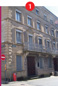
1 Ancienne manufacture Bonnassieux