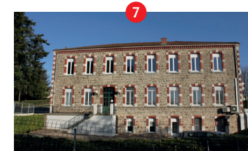
7 Ancienne Broderie Guerpillon

• Remontez la rue Denis Boulanger (attention sens interdit), tournez à droite au niveau de la place Jean Jaurès.