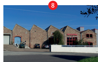
8 Usine Ducreux-Messy

• Remontez par la rue Gambetta puis tournez à droite rue L. Minjard, passez devant la caserne des Pompiers.