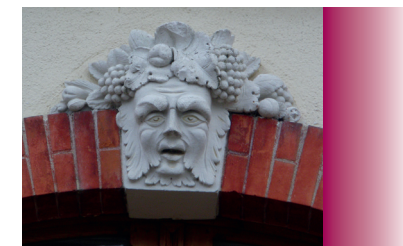
Agrafe de fenêtre maison Martinod