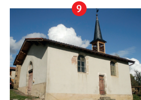
9 Chapelle Saint-Loup