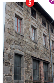
5 Atelier Trillat-Varillon

DEPART : Office de tourisme • Distance : 6 km • Durée : 2h30