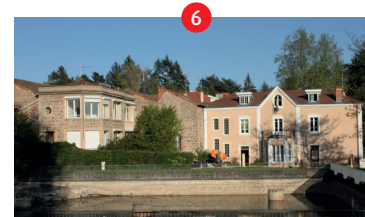
6 Ancienne usine Ducreux