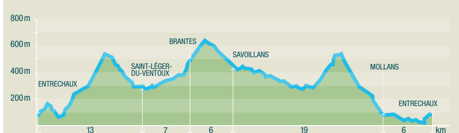
15 La vallée du Toulourenc - Circuit principal : 51 km