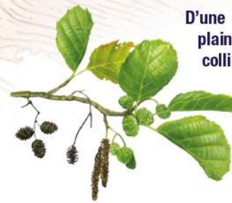
AULNE GLUTINEUX DESSIN P.R.

D'une rive à l'autre de la Sioule dans la plaine jenzatoise, partez sillonner les collines proches – offrant de belles vues sur Charroux et la vallée – et les bords d'une rivière aux eaux calmes.