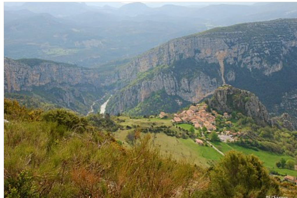
Philippe CHAUVEAU / Verdon Tourisme