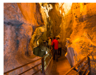
Grottes de St Christophe