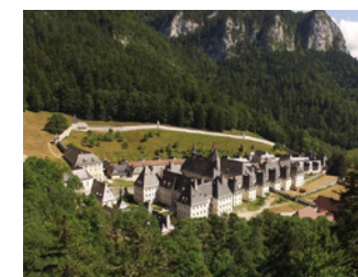
Musée de la Grande Chartreuse