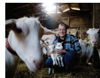
Ferme de Plantimay