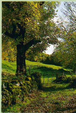
Chemin entouré de murets

Cette petite randonnée est accessible à tous. Son centre d'intérêt est le Château de La Chassagne.