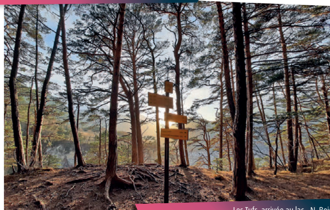
Les Tufts, arrivée au lac - N. Bois

Après cette immersion dans l'Histoire, vous prenez le temps, entre pinèdes et bruyères, au fil du torrent tumultueux de Saint-Antoine, de ressentir le mélange des odeurs de résine et d'humus forestier, qui vous accompagnent jusqu'à La Norma. Quel luxe de pouvoir profiter d'une sieste fraîcheur dans la bulle de bien-être du plan d'eau des Avenières ; un vrai « petit bonheur » !