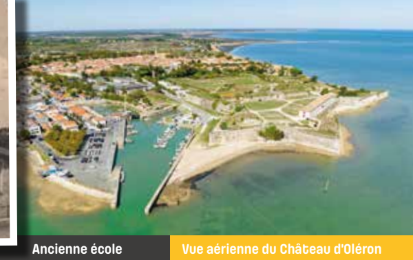
Vue aérienne du Château d'Oléron