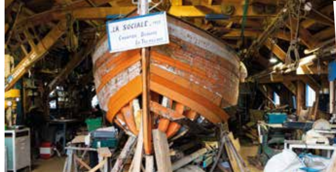
Chantier naval Robert Léglise