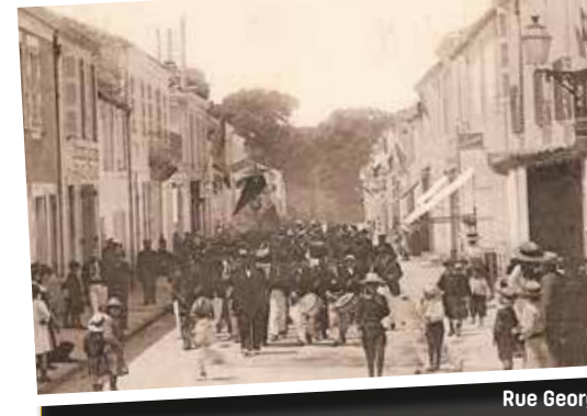
Rue Georges Clemenceau