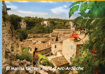
© Marina Géray - Pont d'Arc-Ardèche

Départ : Labeaume Coord. GPS : N44°26'52,8" / E4°18'23,1" Distance : 10,9km Durée : 3h45 Dénivelée cumulée : 324m Balisage : blanc et jaune (PR)