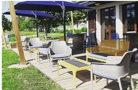
SarL A&amp;M Loisirs

Côté bar plusieurs choix de bières pression, des vins bio, vins locaux. Un café équitable, des thés bio et une large gamme de boissons soft sur place ou à emporter, vous avez le choix!