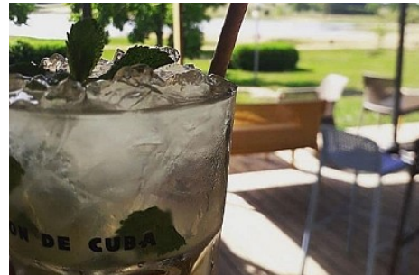
SarL A&amp;M Loisirs

Tourisme durable : Nous sommes ouverts uniquement en saison, mais avons pour but de vous faire passer un bon moment, dans un cadre privilégié avec le maximum de produits de qualité tout en restant bienveillant et actif au niveau de l'économie locale, de notre équipe et des impacts environnementaux que nous générons.