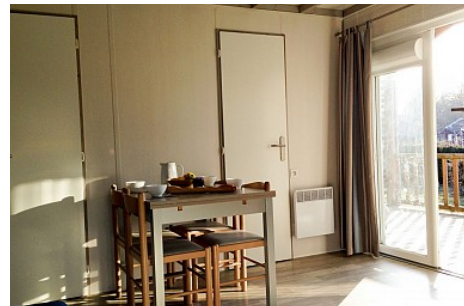
Sarl A&amp;M Loisirs

Contact : Téléphone : 04 73 85 74 84 Email : contact@camping-etang-philippe.fr Site web : https://www.camping-etang-philippe.fr/la-region-et-ses-alentours/sortir/ https://www.camping-etang-philippe.fr/emplacements/ Facebook : https://www.facebook.com/campingetangphilippe/ Google+ : https://www.google.com/search?client=firefox-b-d&q=camping+etang+philippe&id=0x47f748a2bae036b3:0x61b90182bfe61c81,1,,