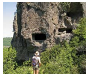
Les balmes de Montbrun

Cette direction permet de pénétrer dans le site.