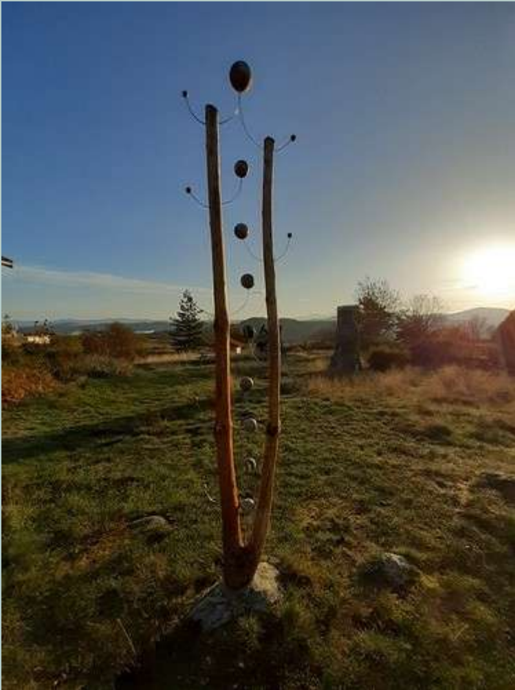
« Le temps des oiseaux » bois ,terre cuite inox

L'atelier Pieris se situe au lieu- dit « les salles » commune du Brignon, département de la Haute Loire, région Auvergne Rhône Alpes. Construction en ossature bois, respectueuse de l'environnement, il domine la vallée de la Loire sauvage, site admirable qui offre l'occasion de découvrir un environnement authentique et préservé ( randonnées pédestres balisées... )