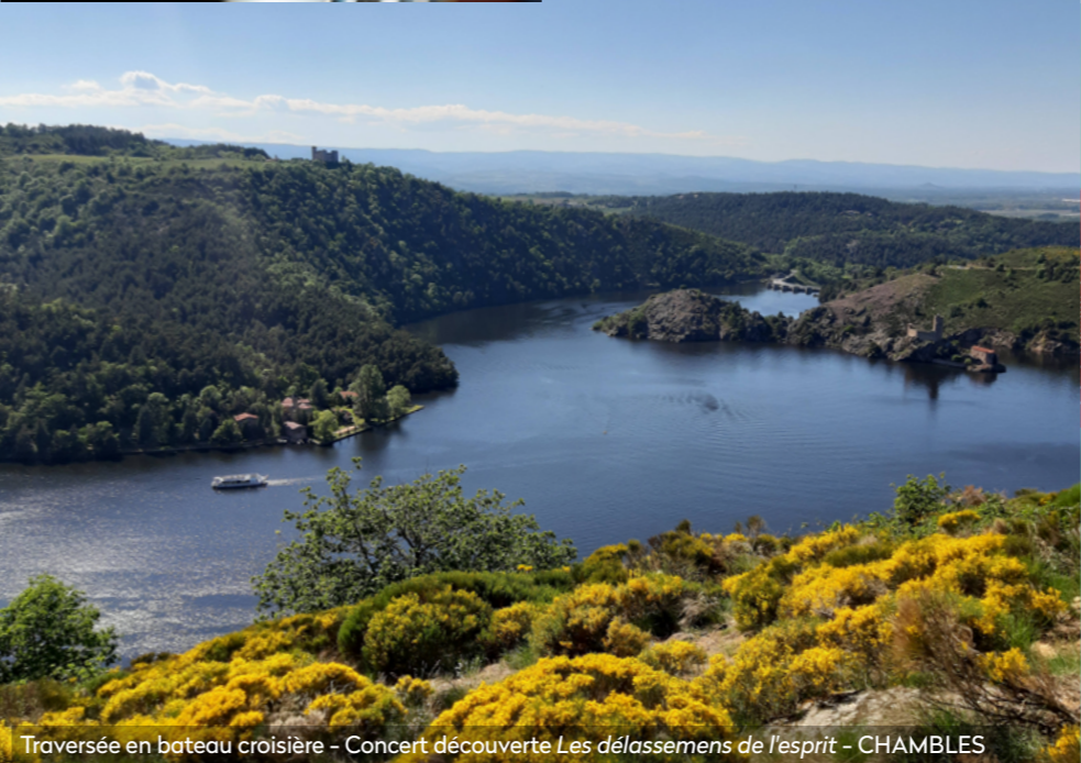
Traversée en bateau croisière - Concert découverte Les délassemens de l'esprit - CHAMBLES