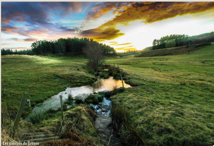
Les sources du Grozon