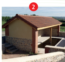
Fontaine et Lavoir