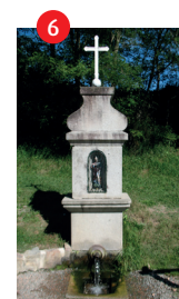
Fontaine St Austrégésile