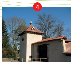
Pigeonnier de Sugny