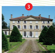
Château de Sugny