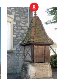
Puits et ancien pavillon de chasse