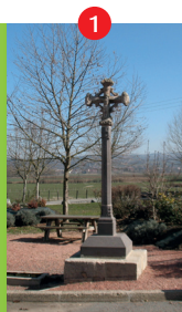
Croix d'Albon de Sugny

• Faites le tour de la bâtisse et redescendez la rue du bourg jusqu'à la place Berthelot et la statue d'Albon de Sugny 1 .