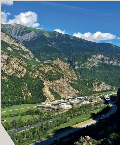
Vue sur la vallée avec La Tour de Bérold

6 Catassote - Continuer tout droit au croisement pour retrouver la route D74. Rejoindre ensuite le panneau de Bois Ladonne en prenant la route à droite, puis continuer sous le pont pour retourner au parking de la chapelle.