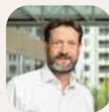
Fabrice PANNEKOUCKE Président de la Région Auvergne-Rhône-Alpes