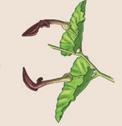
2- Aristolochie pistilochie

La Molinie tardive est une espèce protégée. Elle est présente sur l'ensemble de la région PACA avec de fortes disparités. Concernant les Alpes de Haute Provence, on peut la retrouver dans les vallées de la Durance, de la Bléone et du Verdon.