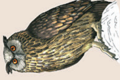
5- Grand-duc d'Europe

Il occupe les habitats présentant des souches et de vieux arbres feuillus déperissants. Les larves de Lucane consomment le bois mort et se développent dans le système racinaire des arbres. Essentiellement lié aux chênes, on peut toutefois le rencontrer sur un grand nombre de feuillus.