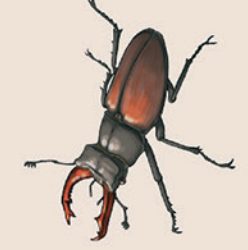
4- Lucane cerf-volant

On peut la voir voler dès le mois de mars. Elle fréquente principalement des zones sèches colonisées par l'Aristolochie pistilochie, l'unique plante sur laquelle elle pond ici ses oeufs.