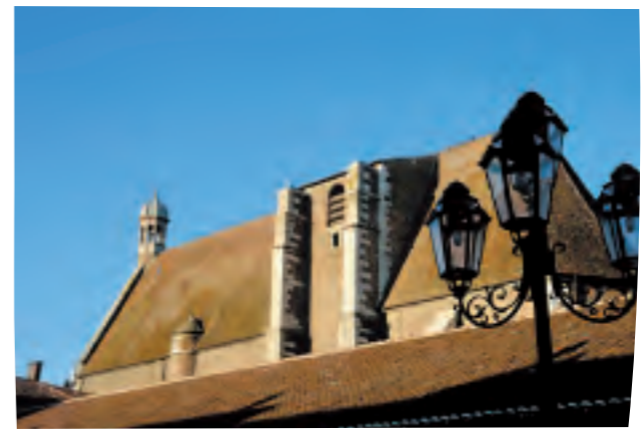
Châtillon-sur-Chalaronne est une étape touristique incontournable : Station Verte de Vacances, labellisée "Plus Beau Détour de France" et "Ville et Métiers d'Art"...