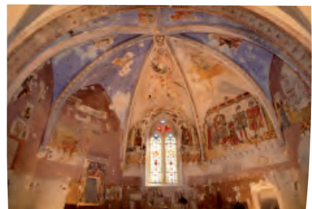
La Chapelle Notre-Dame-de-Beaumont et ses fresques datant du XVe.