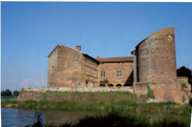
Resté intact à part ses tours écimées à hauteur de bâtiment, l'ancienne forteresse féodale paraît émerger d'un grand étang couvert de nymphéas et d'iris...