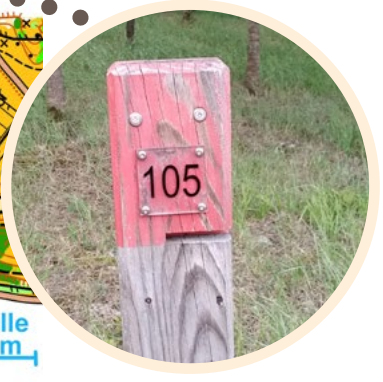
Echelle 100 m