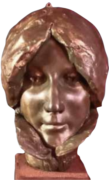
Autoportrait, Sarah Bernhardt, Plâtre patiné, circa 1890

Dès les années 1875, elle s'initie au modelage, développant parallèlement une activité de peintre et de sculptrice aujourd'hui considérée comme exceptionnelle.