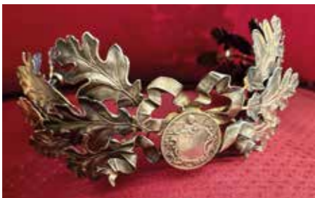
Couronne de laurier, argent massif, New York, 1913, collection et cliché Pierre-André Hélène.

Lors de la vente aux enchères des meubles et objets ayant appartenu à la tragédienne, le journaliste Maurice Feuillet évoque les différents lots en ces termes: « Ils sont devenus les authentiques reliques de celle dont le nom vivra longtemps dans la mémoire des hommes et que des mains pieuses se transmettront en souvenir d'une Française qui fut grande par le talent, par l'esprit et par le cœur. »