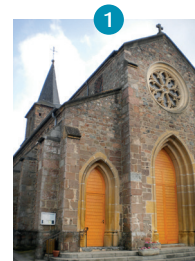
Eglise de Pinay