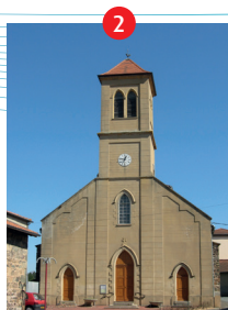
Eglise de Saint Jodard