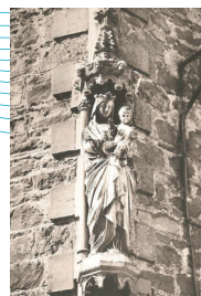
Statue de la vierge